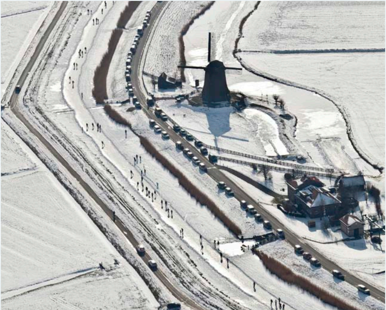
Luchtfoto: DUTCHPHOTO - USA Dorpentocht langs de Schermer molens

Op 13 februari viel de dooi in en was het met schaatsen op natuurijs weer gedaan. Deze speciale editie van Ijsnieuws is een ode aan schaatsen op natuurijs in ons polderland en een blijk van waardering voor vrijwilligers van ijsclubs die dit mogelijk hebben gemaakt.